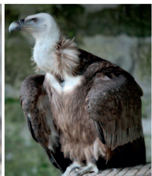
Von li nach re: „Bell“ heißt das Glöckchen, das sich am „Geschüh“, dem Halsband und Leine für Greifvogel, befindet. Schopfkarakara Kaspar präsentiert seine Spielzeugkollektion. Neben vielen anderen imposanten Vögeln posieren afrikanische Raubadler oder Gänsegeier vor der historischen Kulisse der Stauferburg.