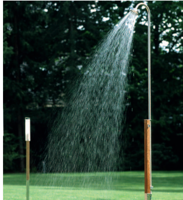
Kalter Guss und zugleich Erfrischung an heißen Tagen.

Sämtliche Gartenduschen lassen sich leicht und problemlos installieren. Die einfachen Modelle werden dank eines Rasendorns einfach an einem geeigneten Platz im Garten, in die Erde gesteckt. Hochwertigere Ausführungen werden in der Regel auf einer Plattform angeschraubt und dann auf dem Fußboden montiert. Hierzu reicht ein Fundament völlig aus. Diese Modelle nutzen als Untergrund Lattenroste aus witterungsbeständigem Holz, in Verbindung mit einer Einfassung aus Edelstahl. Wenn man nun darunter eine Sickergrube mit Kieselsteinen anlegt, wird das Wasser auch ohne Anbindung an die Kanalisation aufgenommen. Die Gartenduschen verfügen je nach Ausführung und Preis über ein Außengewinde für Metallverbindungen oder einen Anschluss für den Gartenschlauch. Somit kann die Gartendusche grundsätzlich überall dort aufgestellt werden, wohin der Gartenschlauch reicht.