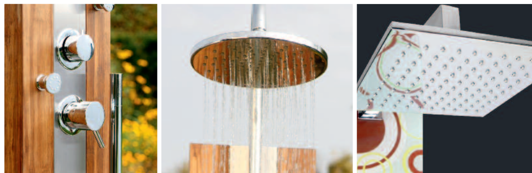
Schöner kann eine Gartendusche nicht sein: Pffiffige Details und edles Duschfeeling.