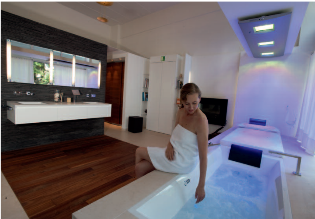
Whirlpool, Sonnenwiese, Dampfbad – alles funktionsbereit zum Ausprobieren.

Das Pforzheimer Traditionsunternehmen Richard Staib GmbH & Co.KG im Brötzinger Tal setzt neue Impulse zu den Themen Bad und Heizung. Stolz präsentiert das Familienunternehmen seine komplett neu gestalteten Ausstellungsräume in der Göllichstraße. Hier wird das Bad zur Wohlfühl-oase. Themen der neuen Ausstellung sind Wellness & Wohlbehagen, Ökonomie & Ökologie, Design & Funktion sowie Ästhetik & Harmonie. Unter anderem sind zu sehen eine Sauna in Paneelbauweise mit Echtglasfront sowie Licht- und Klangobjekten. Eine Sonnenwiese und der Whirlpool runden den Wellnessbereich ab. Verschiedene Duschszenarien wie Regenhimmel und Multifunktionsbrausen versprechen ein besonderes Duscherlebnis. Auch das Dampfbad ist voll funktionsbereit. Am Brausebrunnen kann der Kunde den Duschkopf seiner Wahl gleich ausprobieren. Ein waldte Pelletkaminofen erwärmt nicht nur den Ausstellungsraum sondern zeigt, dass eine moderne inno-