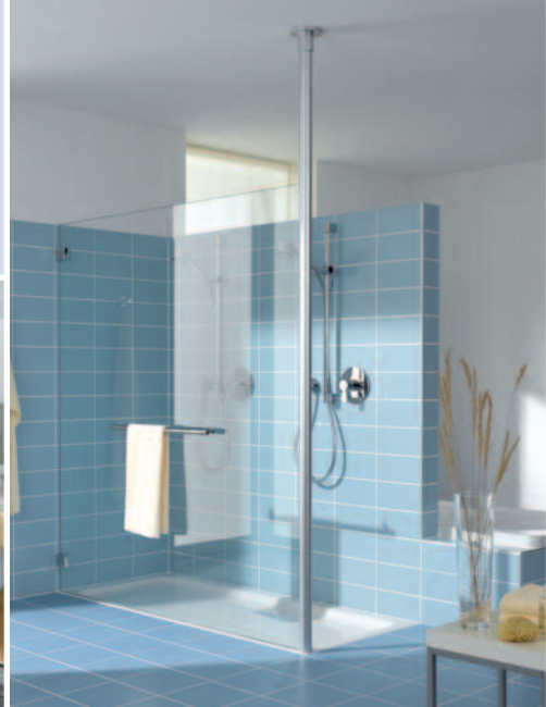
Kermi Duschen: Die perfekte Anpassung an die Badsituation. Absolut zuverlässig gehalten von massiven Deckenstützen von bis zu drei Metern Höhe. Präzise Maßanfertigungen ermöglichen die perfekte Integration in die individuelle Raumarchitektur – verbunden mit besonderer Design-Qualität.