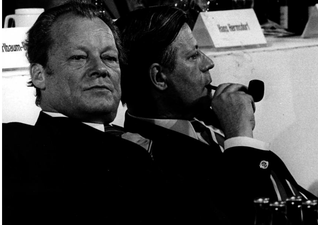
Oben: Barbara Klemm, Willy Brandt, Helmut Schmidt, SPD-Parteitag, Hannover, 1973, s/w-Foto, © Barbara Klemm, Frankfurt/Main Links: Barbara Klemm, Alfred Hitchcock, Frankfurt a.M., 1972, s/w-Foto, © Barbara Klemm, Frankfurt/Main